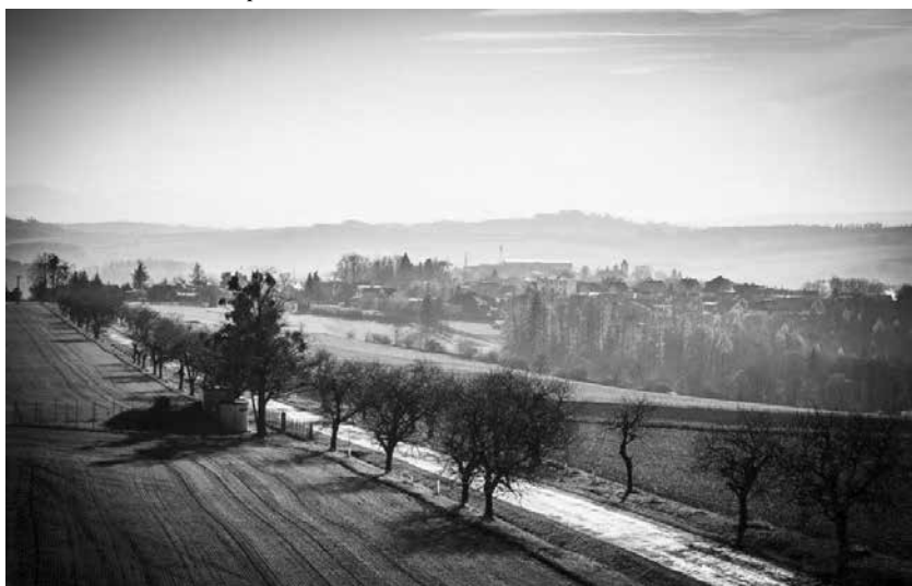
Pohled z rozhledny