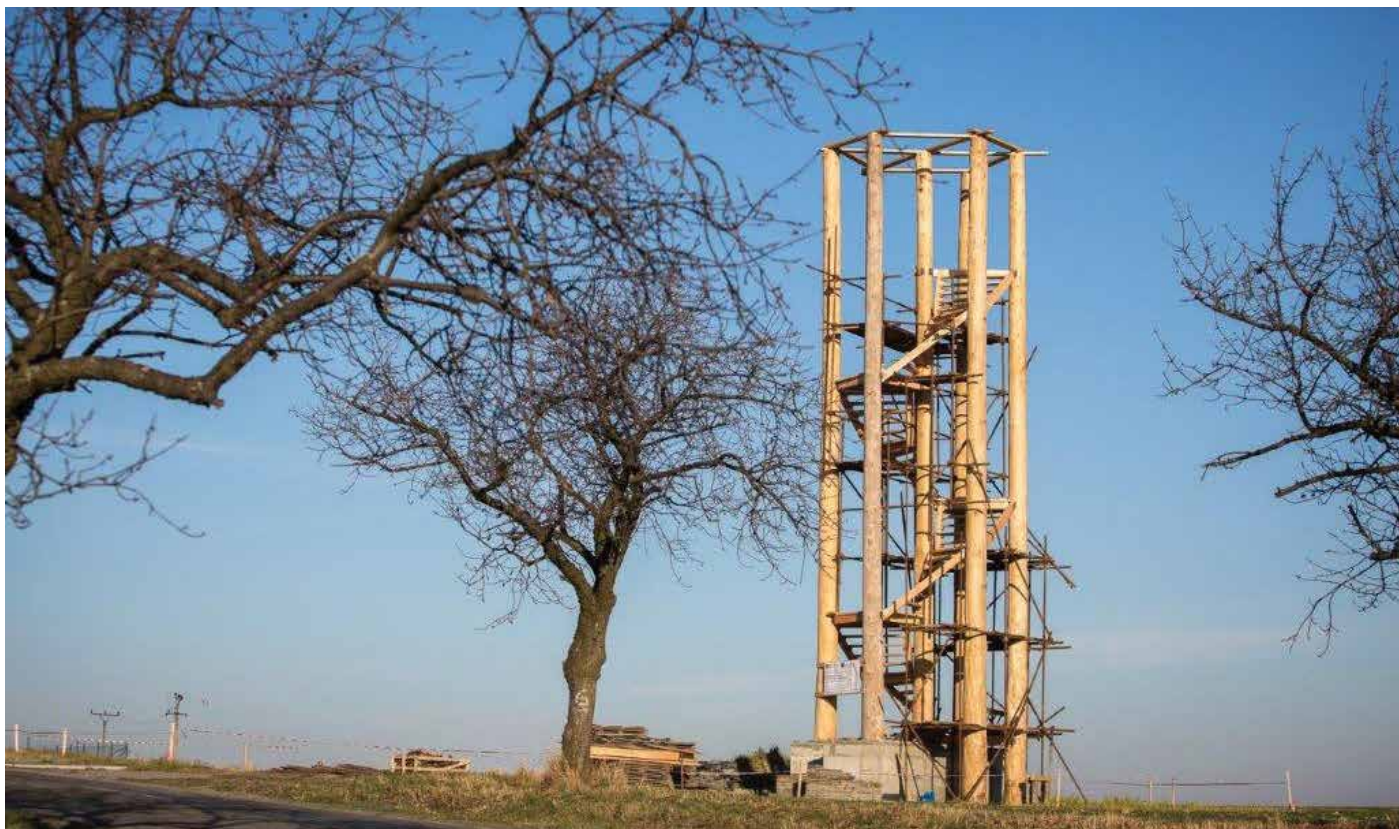
Pohled z rozhledny