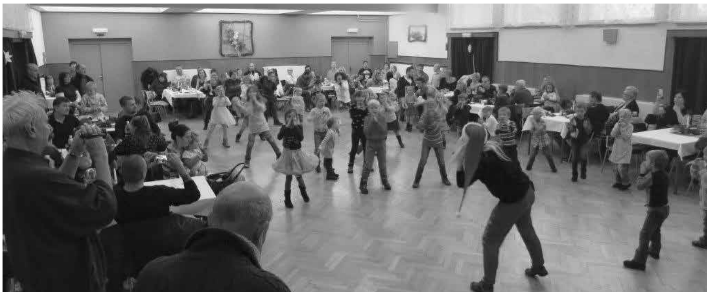
Děti se bavily na nadílce