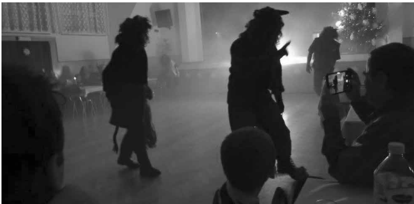
Mikulášská nadílka – peklo