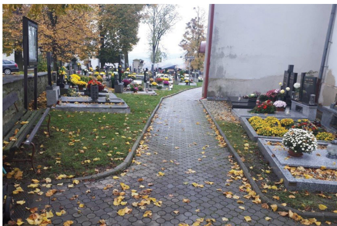
Podzim na hřbitově