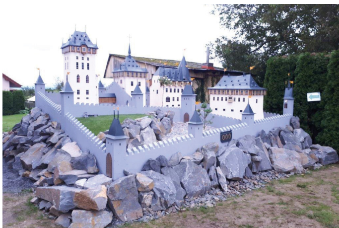
Karlštejn u Lihotzkých