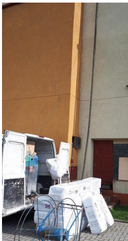
Zateplení střechy kulturního domu