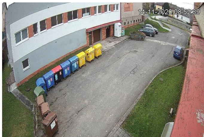
Zkušební provoz kamerového systému