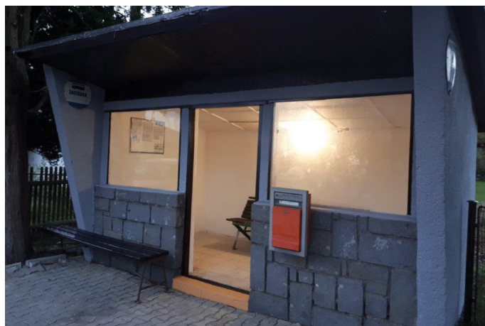
Oprava čekárny autobusů na Novém Světě