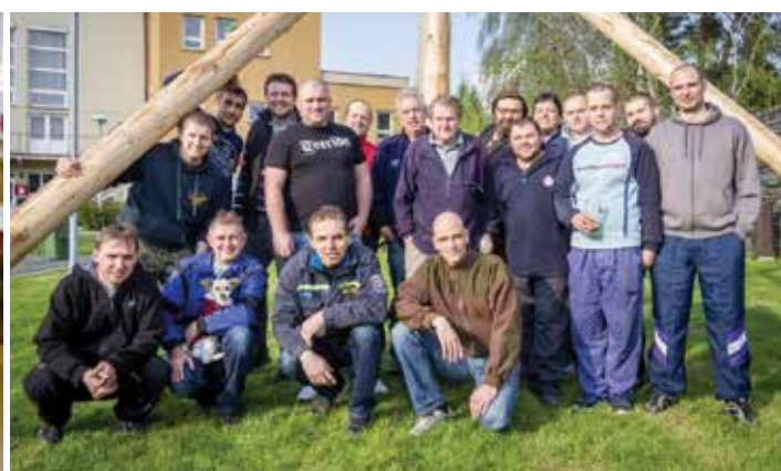
Máj už stojí