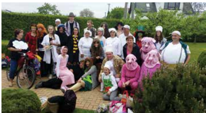
Postavičky Cesta pohádkovým lesem