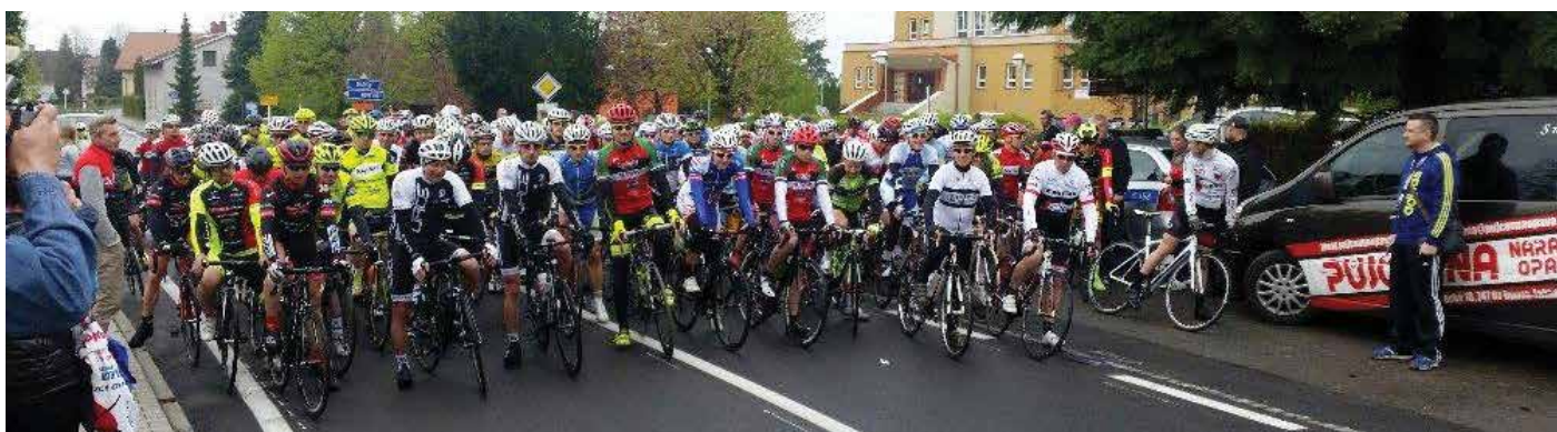
Cyklistický závod Slatina Bagbike 2017