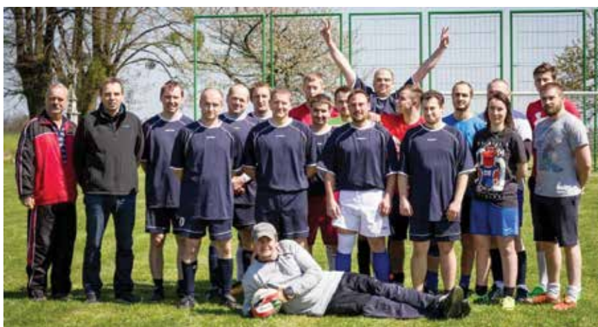
Fotbal – svobodní