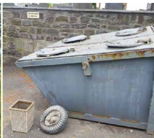
Odpad ze hřbitova