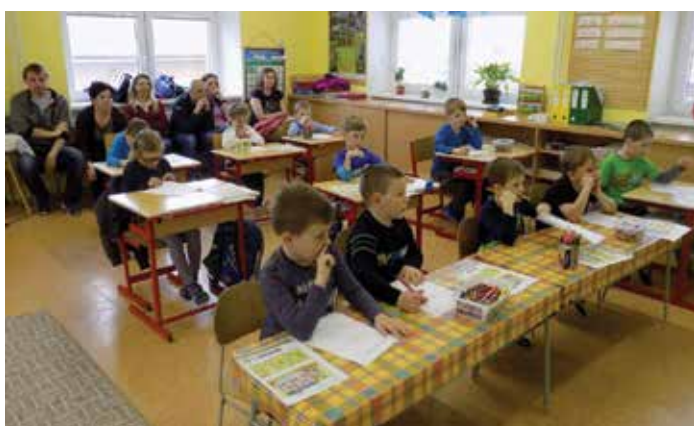
Připravujeme se na 1. září