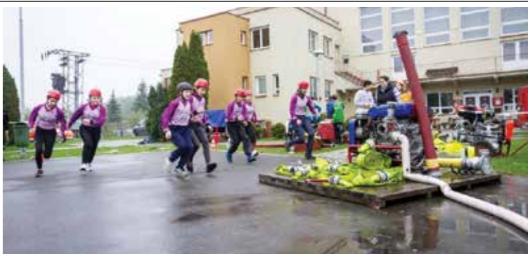
Mladí hasiči v akci