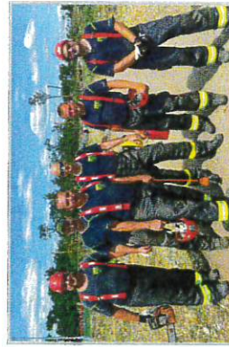
Výbor SDH Slatina